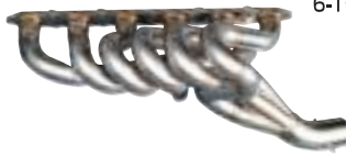
(ケンメリ・432 は出口要改造)

S20エンジンの弱点とされている低速トルクの落ち込みをカバーして中速域までの谷間を解消しました。高回転までスムーズに吹け上がりフィーリング音共に最高です。