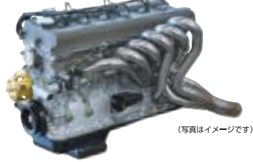
(写真はイメージです)