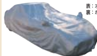
表: オックスシルバー 裏: ボディにやさしいネル加工