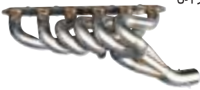
(ケンメリ・432 は 出口要改造)